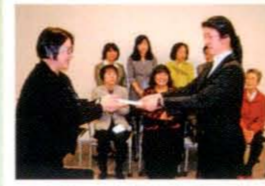
高校ソフト御祝金贈呈式