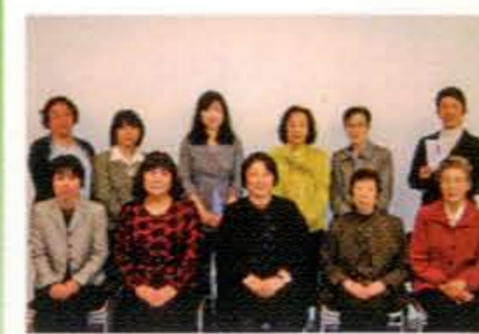
平成24年度常任幹事会